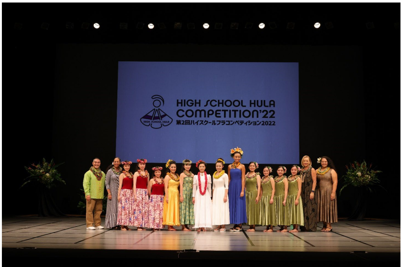
第2回ハイスクールフラコンペティション 2022