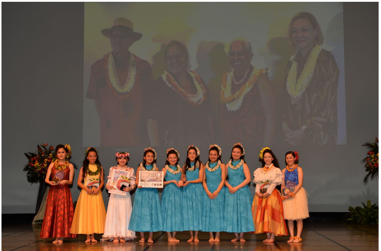
第1回ハイスクールフラコンペティション2021